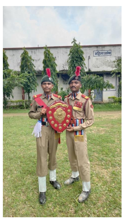
1<sup>ST</sup> PIECE IN 2024 PARADE